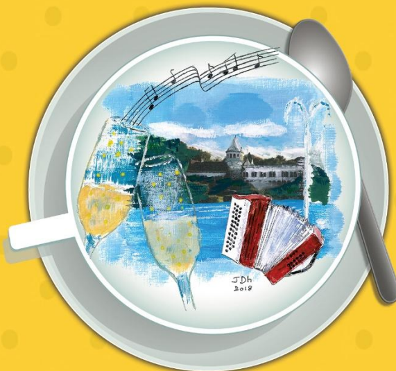
Illustration : d'après une idée originale de Jeannine D'hoore Éditeur responsable : CCCA, 75 avenue de Merode - 1330 Rixensart

CHÂTEAU DU LAC DE GENVAL - SALLE ARGENTINE